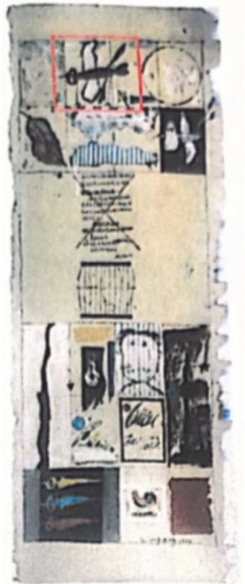
【圖5】被訴侵權畫作Y36 （紅色框線內為原告主張相似的部分）