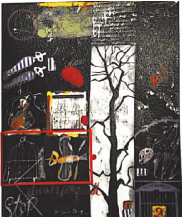
【圖4】被訴侵權畫作Y12 （紅色線框內為原告主張相似的部分）