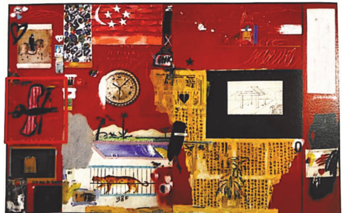
【圖9】被訴侵權畫作Y69 （紅色框線內為原告主張相似的部分）