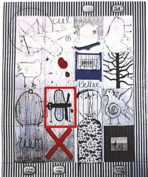
【圖7】涉案權利畫作A （紅色框線內為元素A9）