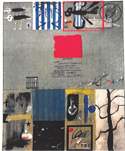
【圖8】被訴侵權畫作Y47 （紅色框線內為原告主張相似的部分）