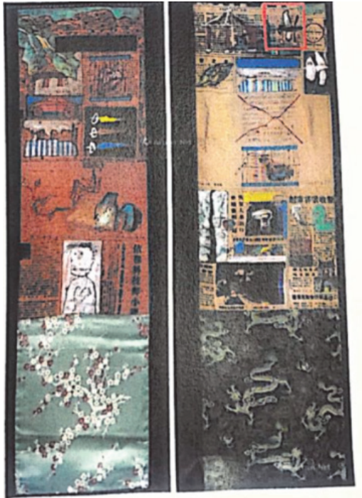
【圖6】被訴侵權畫作Y34 （紅色框線內為原告主張相似的部分）